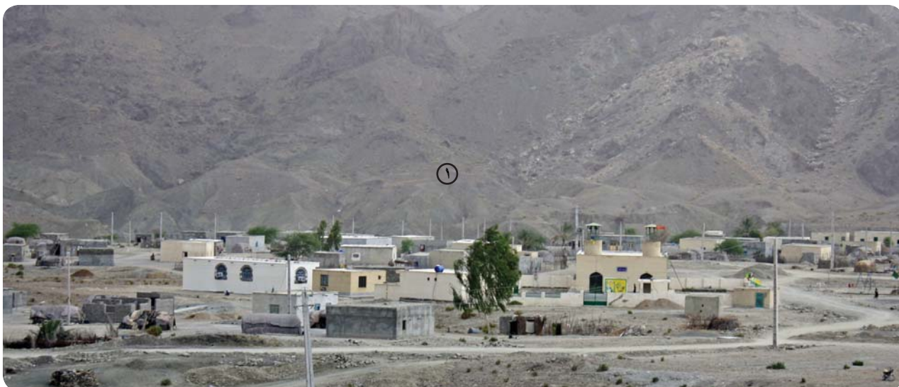
نمای روستای چوخون، پایگاه فرهنگی روستا در کنار مسجد