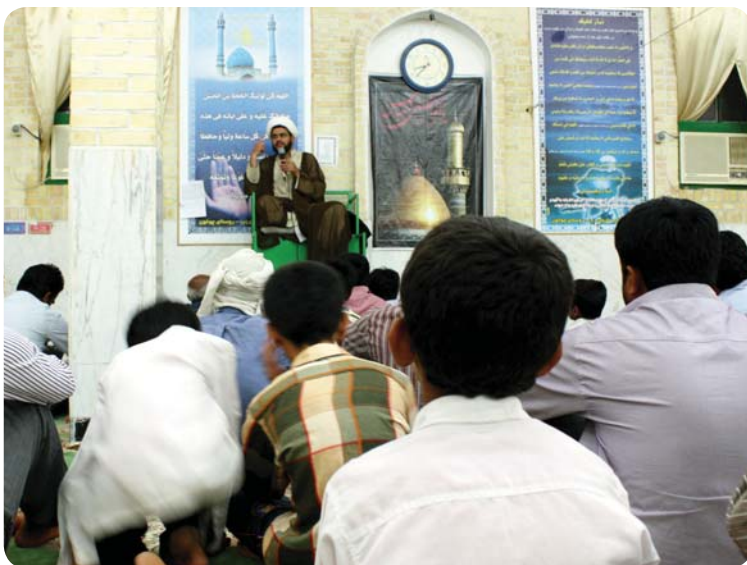
برنامه سخنرانی عمومی، روستای چوخون، ۲۹ تیر ۸۹

یکی از برنامه‌هایی که برای شب‌ها در نظر گرفته شده بود، سخنرانی جناب حجت‌الاسلام والمسلمین انصاری بود. ایشان در سخنرانی خود ضمن نقد فرهنگ غربی و آفت‌هایی که بر روستا می‌تواند داشته باشد، اشاره‌ای به ویژگی‌های مثبت زندگی روستایی داشتند. پایان سخنرانی همراه با ذکر توسلی به ائمه اطهار بود.