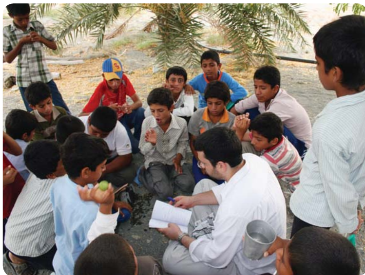
اردوی معرفتی، نخلستان‌های اطراف درجگ، ۲ مرداد ۸۹

در مقطع راهنمایی علاوه بر کلاس‌های فوق یک کلاس برای آموزش احکام بلوغ برگزار شد. در این کلاس که حدود دو ساعت و نیم طول کشید، ابتدا مطالبی راجع به انتخاب مرجع تقلید گفته شد، سپس با استفاده از نرم‌افزار آموزشی مسافر عمره احکام بلوغ و غسل آموزش داده شد.