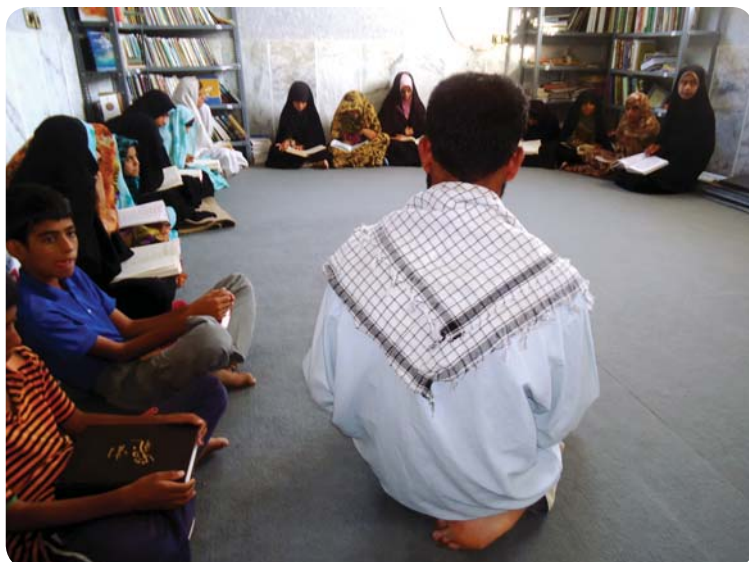
کلاس آموزش قرآن در پایگاه روستا، روستای کوه حیدر

پس از افتتاح پایگاه و انتخاب یکی از طلبه‌های روستا به عنوان مسئول پایگاه، کلاس‌های آموزش قرآن خواهران و برادران روستا به پایگاه فرهنگی منتقل و با استفاده از قرآن‌های اهدایی (قرآن حکیم) روند آموزش ادامه پیدا کرد. کتابخانه قبلی روستا در کنار کتابخانه اهدایی پایگاه منتقل و کتاب‌ها کُدگذاری و لیست‌برداری شد. در ماه مبارک رمضان علاوه بر حلقه ختم قرآن، کلاس‌های معرفتی شامل سیره ائمه معصومین توسط یکی از طلبه‌های روستا در پایگاه برگزار می‌گردید.