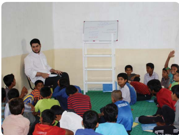
کلاس معرفتی راهنمایی، روستای کوه حیدر، ۳۰ تیر ۸۹

یکی از جلسات معرفتی این مقطع اختصاص به پاسخگویی مربی به پرسش‌های جوانان روستا داشت. مسائل و دغدغه‌های جوانان از انتخاب شغل تا مسائل دینی از نکاتی بود که در این جلسات مطرح گردید.