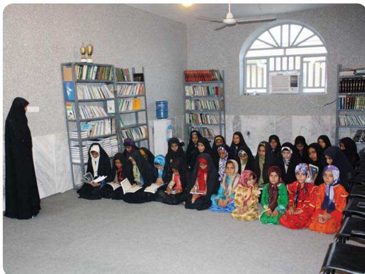
کلاس قرآن پایگاه فرهنگی، روستای چوخون، ۳ آذر ۸۹