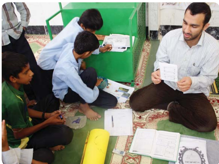
کلاس خلاقیت، روستای چوخون، ۲ مرداد ۸۹

در این کلاس‌ها موضوعاتی درباره امام خمینی (ره) به دانش‌آموزان داده شد و از آن‌ها خواسته شد که در رابطه با آن موضوع‌ها تحقیق کنند و در قالب‌های نشریه، روزنامه دیواری، کاردستی و... با خلاقیت خودشان یک خروجی از تحقیق خود بدهند. همچنین موضوعات