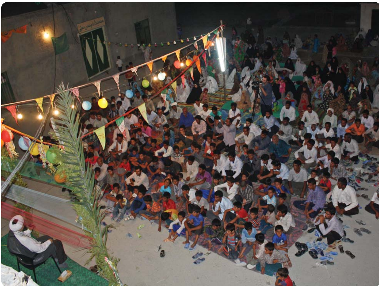
برنامه عمومی جشن میلاد حضرت علی اکبر، روستای کوه حیدر، ۳۱ تیر ۸۹

به منظور استفاده عموم روستا از برنامه‌ها، محدود نکردن حوزه تأثیر پایگاه فرهنگی به جوانان و آشنایی بیشتر مردم با اهداف پایگاه فرهنگی به منظور همراه شدن مردم با آن، هر شب در مسجد روستاها برنامه‌ای عمومی برگزار می‌شد. مردم روستا اعم از زن و مرد و کودک و پیر از برنامه‌ها استقبال می‌کردند و علاقه خود را به ادامه چنین برنامه‌هایی ابراز می‌داشتند.