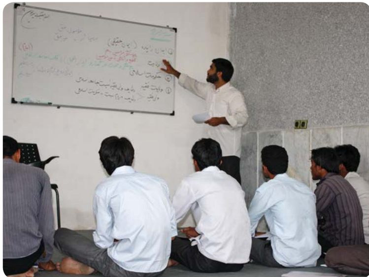
کلاس صهبا، روستای کوه‌حیدر، ۲۹ تیر ۸۹

محتوای کلاس‌های این دوره پیرامون بحث ولایت و حکومت و نیز شخص مقام معظم رهبری بود. در ابتدا در مورد اهمیت بحث ولایت و حکومت مواردی مطرح شد و پیرامون این موضوع که شهادت دادن به پیامبری رسول الله، چه تعهدی را بر دوش شهادت دهنده می‌گذارد. سپس به بحث ولایت در قرآن پرداخته شد. ولایت در قرآن در سه حوزه مطرح می‌شود. حوزه ارتباط با جامعه مومنین، ارتباط با محور