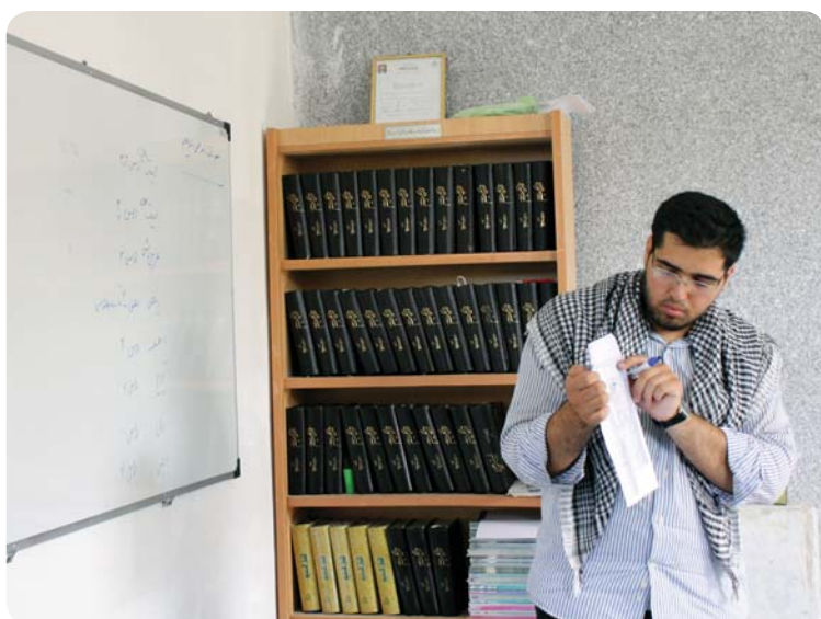
جلسه توجیهی روش مطالعه و برنامه‌ریزی، روستای کوه حیدر، سفر مهرماه ۸۹

پس از افتتاح پایگاه و انتخاب یکی از طلبه‌های روستا به عنوان مسئول پایگاه، کلاس‌های آموزش قرآن خواهران و برادران روستا به پایگاه فرهنگی منتقل و با استفاده از قرآن‌های اهدایی (قرآن حکیم) روند آموزش ادامه پیدا کرد. کتابخانه قبلی روستا در کنار کتابخانه اهدایی پایگاه منتقل و کتاب‌ها کُدگذاری و لیست‌برداری شد. در ماه مبارک رمضان علاوه بر حلقه ختم قرآن، کلاس‌های معرفتی شامل سیره ائمه معصومین توسط یکی از طلبه‌های روستا در پایگاه برگزار می‌گردید.