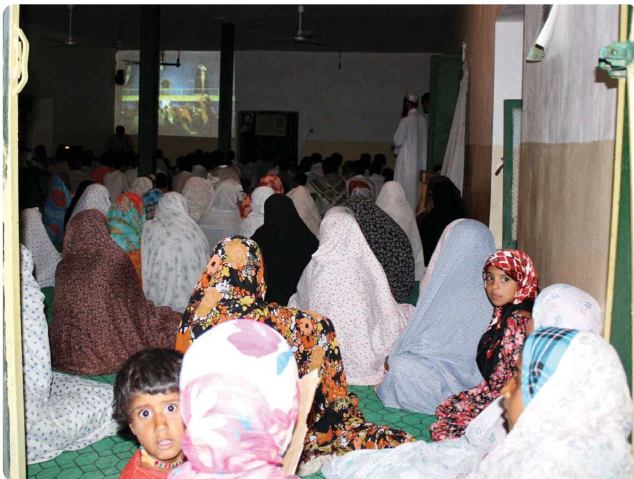
برنامه عمومی صهبا، مسجد روستای کوه‌حیدر، ۲۹ تیر ۸۹

هدف انتخاب شده برای این برنامه عمومی، محکم کردن ارتباط و اتصال بین مردم روستا با مقام معظم رهبری بود. موضوعی که در این جلسه مطرح شد، نقش مردم در تشکیل نظام اسلامی و همچنین حفظ آن در بیانات مقام معظم رهبری بود.