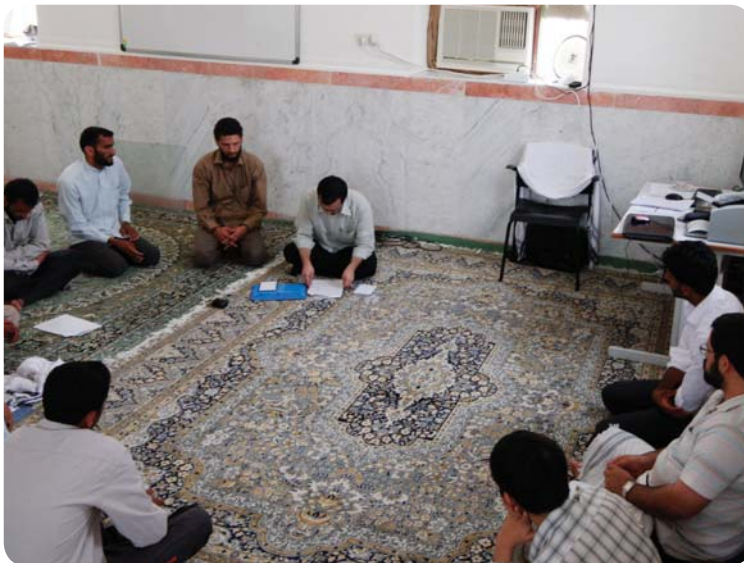
جلسه با فعالین فرهنگی روستای درجگ، پایگاه فرهنگی روستا، ۱ مرداد ۸۹

روستای درجگ نسبت به دو روستای دیگر بستر مناسب‌تری برای کارهای فرهنگی دارد، به همین دلیل برنامه‌های متنوعی در پایگاه این روستا اجرا می‌شود. برنامه‌هایی که بعد از اردو در پایگاه فرهنگی روستای درجگ ادامه پیدا کرد به شرح زیر است: برگزاری کلاس تفسیر و حفظ قرآن برای خواهران؛ کلاس روخوانی و حفظ برای برادران دبیرستانی؛ سرود و کتابخوانی برای برادران دبیرستان و راهنمایی؛ کلاسهای معرفتی و تفریحی برای دبستانی‌ها؛ راه‌اندازی کتابخانه روستا برای ترویج روحیه کتابخوانی در اهالی روستا؛