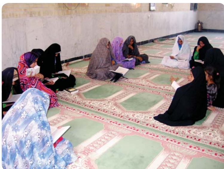
کلاس قرآن خواهران در سفر تبلیغی حجت الاسلام انصاری، روستای چوخون، ۵ شهریور ۸۹