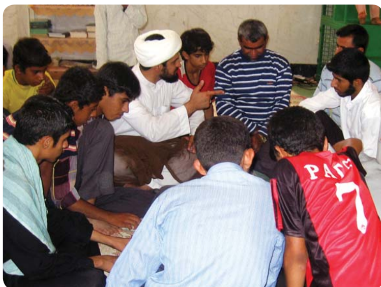
سفر تبلیغی حجت‌الاسلام انصاری، روستای چوخون، ۲ شهریور ۸۹

همچنین با توجه به پیگیری مردم روستا و تقاضای ایشان مبنی بر کمک پایگاه فرهنگی به دانش‌آموزان روستا از نظر تحصیلی و پیرو جلساتی که اولیای دانش‌آموزان در پایگاه داشتند، در سفری که مسئولین روستای کوه حیدر در مهر ۸۹ داشتند، کتاب‌های کمک آموزشی مناسب برای کتابخانه پایگاه تهیه و تحویل داده شد. همچنین کلاس توجیهی برای دانش‌آموزان پیش‌دانشگاهی و دبیرستانی روستا برگزار گردید که در آن روش مطالعه و برنامه‌ریزی درسی آموزش داده شد. همچنین با مدیر مجتمع آموزشی کوه حیدر و معلمان مقطع راهنمایی جلساتی برگزار گردید و راجع به وضعیت مدرسه، دانش‌آموزان و روش‌های مناسب تدریس هر درس صحبت‌هایی شد. همچنین قرار شد از امکانات پایگاه برای پخش فیلم‌های کمک آموزشی و مطالعه دانش‌آموزان استفاده گردد. علاوه بر این کلاس‌های طرح مدرسه قرآن آموزش و پرورش در پایگاه برگزار می‌گردد.