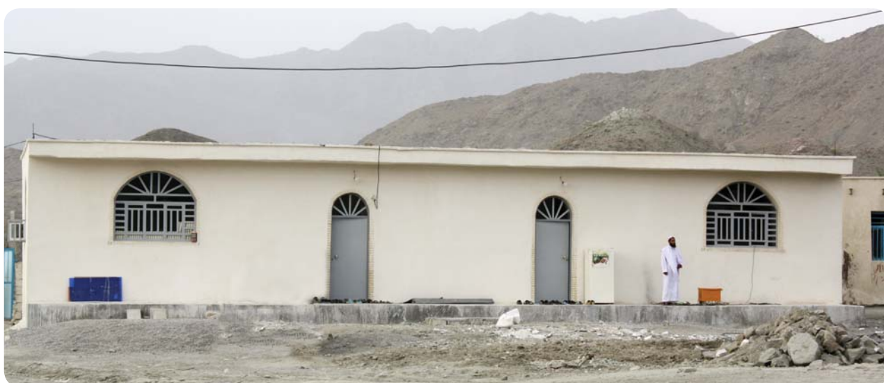
پایگاه فرهنگی روستای کوه حیدر