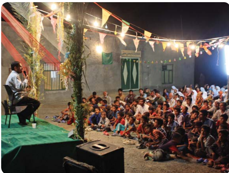
صحبت‌های مسئول پایگاه، روستای کوه‌حیدر، ۱ مرداد ۸۹