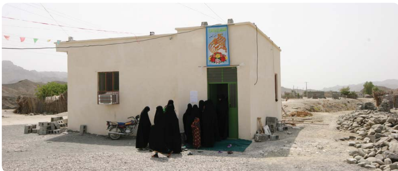
پایگاه فرهنگی روستای درجگ