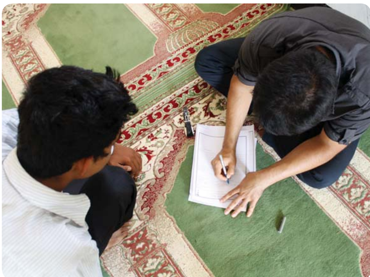
هدایت تحصیلی، روستای چوخون، ۳۰ تیر ۸۹