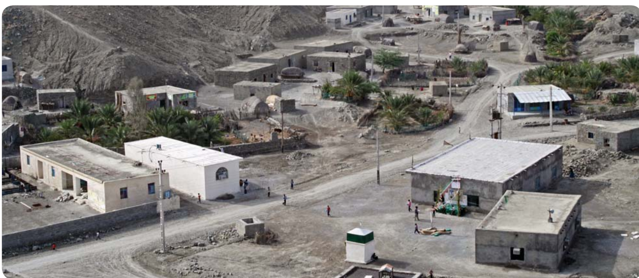
نمای روستای کوه حیدر، پایگاه فرهنگی روستا در کنار دبستان، مسجد و حسینیه