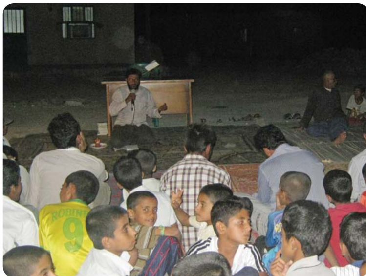
هیأت آلطه، روستای چوخون، ۲۹ مهر ۸۹

بعد از اردوی تابستان، پایگاه فرهنگی روستای چوخون به مدت دو ماه فعالیت نداشت و از اوایل مهرماه فعالیت‌های آن ادامه پیدا کرد. در طول این مدت حجت الاسلام انصاری با هماهنگی موسسه برای تبلیغ ماه مبارک رمضان، بیست روز به روستای چوخون رفت و برنامه‌های متنوعی را برای عموم مردم انجام داد. همسر ایشان نیز با برگزاری کلاس‌های دینی، نقش مهمی در ایجاد حرکت بین خواهران روستا ایفا کرد.