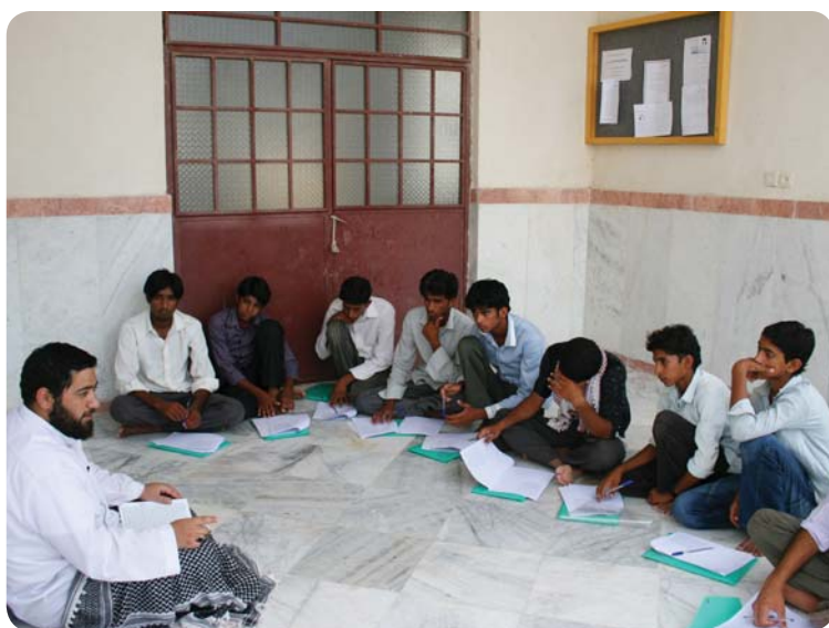
کلاس معرفتی دبیرستان، روستای درجگ، ۲۹ تیر ۸۹

برنامه کلاس معرفتی در دو مقطع جداگانه راهنمایی و دبیرستان اجرا شد. علت هم اهمیت مباحث دینی و قرآنی مطرح شده و لزوم تناسب مباحث با گروه سنی دانش‌آموزان بود.