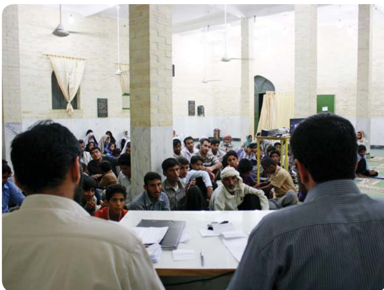
برنامه عمومی مسائل روز، مسجد روستای چوخون، ۳۰ تیر ۸۹

یکی از برنامه‌های عمومی که به صورت گردشگری در سه روستای هدف انجام می‌گرفت بررسی و تحلیل مسائل روز کشور با تکیه بر اتفاقات بعد از انتخابات سال ۱۳۸۸ بود. در این برنامه ابتدا با استفاده از فیلم‌های موجود در رابطه با حوادث بعد از انتخابات و همچنین برنامه‌هایی که از تلویزیون‌های داخلی و خارجی ضبط شده بود، چهره‌ای واضح از پشت پرده این حوادث و اتفاقات ارائه گردید، در ضمن در لابه‌لای فیلم‌ها با توضیحات مجری برنامه، مسائل دقیق‌تر بیان می‌شد. بعد از این تحلیل که حدود نیم ساعت زمان به خود اختصاص می‌داد به پرسش‌های مختلف حضار در رابطه با مسائل سیاسی و مسائل روز پاسخ داده می‌شد. به علت حجم بالای این سوالات و همچنین دقت پاسخ‌دهنده در ارائه پاسخی صحیح و در عین حال به دور از حاشیه، زمان این بخش تا دو ساعت هم طول می‌کشید. این برنامه از برنامه‌های پر مخاطب این دوره قلمداد می‌شود.