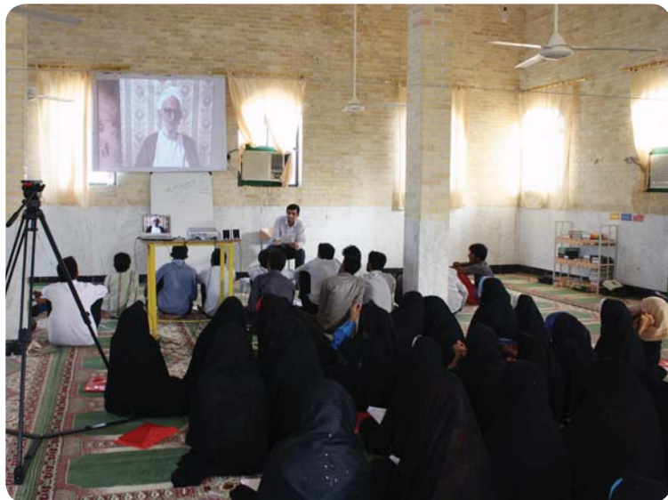
کلاس انقلاب اسلامی، روستای چوخون، ۳۰ تیر ۸۹

در ادامه جریان شکل‌گیری و روند طی شده نهضت امام خمینی (ره) از آغاز مرجعیت ایشان تا پیروزی نهضت در بهمن ۵۷ تبیین شد. در این بازه تاریخی مواردی مانند: مرجعیت امام (ره)، تصویب لایحه انجمن‌های ایالتی و ولایتی، فراندوم انقلاب سفید، قیام ۱۵ خرداد، کاپیتولاسیون، دستگیری و تبعید امام (ره) به ترکیه، تبعید حاج آقا مصطفی، تبعید به نجف، فوت حاج آقا مصطفی و قیام ۱۹ دی، عزیمت امام (ره) به پاریس، تشکیل شورای انقلاب و بازگشت امام (ره) اشاره شد. همچنین در این میان حرکت‌هایی که در مخالفت با رژیم شکل گرفت مانند جبهه ملی، حزب توده، مجاهدین خلق و گروه‌های مبارز مسلمان و شکنجه‌های کمیته مشترک بیان و گوشه‌هایی از حضور مرحوم حاج عبدالله والی و فعالیت ایشان در کمیته استقبال از حضرت امام (ره) بازگو شد.