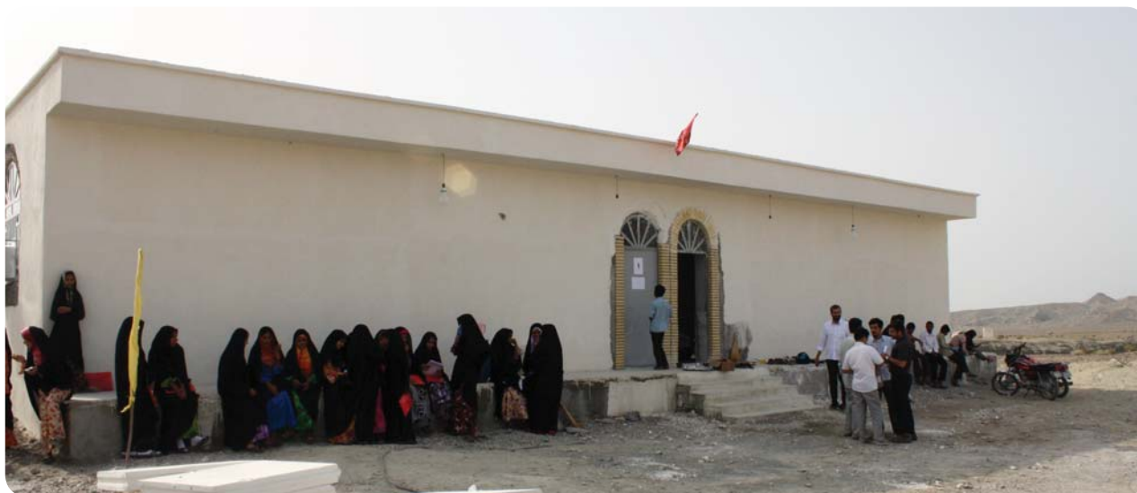
پایگاه فرهنگی روستای چوخون

در سه روستای مذکور کلاس‌های انقلاب و صهبا هر کدام در چهار جلسه طی چهار روز برگزاری اردو دایر بود. همچنین کلاس معرفی برای گروه سنی دبیرستان به بالا شش جلسه و برای گروه سنی راهنمایی در قالب چهار جلسه درسی، یک جلسه آموزش احکام و یک اردوی معرفی برگزار شد. کلاس خلاقیت نیز چهار جلسه برای گروه سنی راهنمایی برگزار گردید. جزئیات طرح درس‌های اجرا شده و دیگر برنامه‌های اردو در ادامه آمده است.