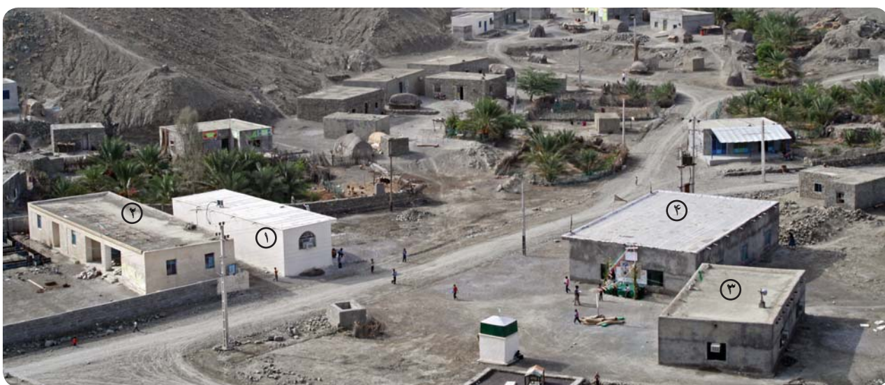
نمای روستای کوه‌حیدر، پایگاه فرهنگی روستا (۱) در کنار دبستان (۲)، مسجد (۳) و حسینیه (۴)