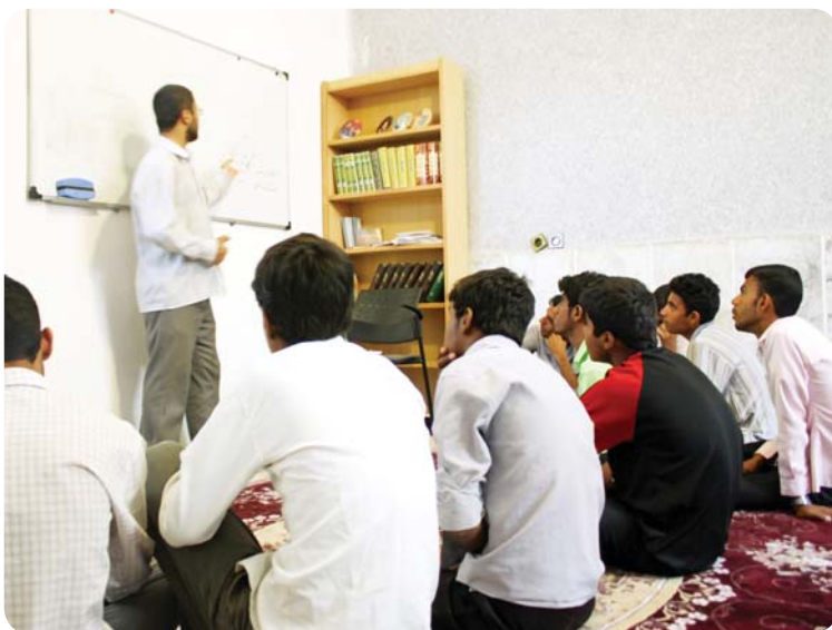
روستای کوه‌حیدر، کلاس صهبا، برادران دبیرستانی

مرکز صهبا با هدف نشر و گسترش منویات مقام معظم رهبری در موسسه جهادی فعالیت می‌کند و کارگروه صهبا نیز زیرمجموعه این مرکز است. این کارگروه اقدام به تدوین محتوای طرح درس برای هر اردو و سازماندهی تعدادی از اعضای مؤسسه جهت تدریس این محتوا نموده است. محتوای مزبور با سه محور اصلی که عبارت بودند از مباحث مطرح شده در پیام‌ها و سخنرانی‌های مقام معظم رهبری پیرامون موضوعات ولایت و حکومت و زندگی سیاسی - مبارزاتی ائمه معصومین (ع) و خلاصه‌ای از زندگینامه مقام معظم رهبری تدوین گردید و به‌طور متوسط در طی شش جلسه برای خواهران و برادران روستایی تدریس شد.