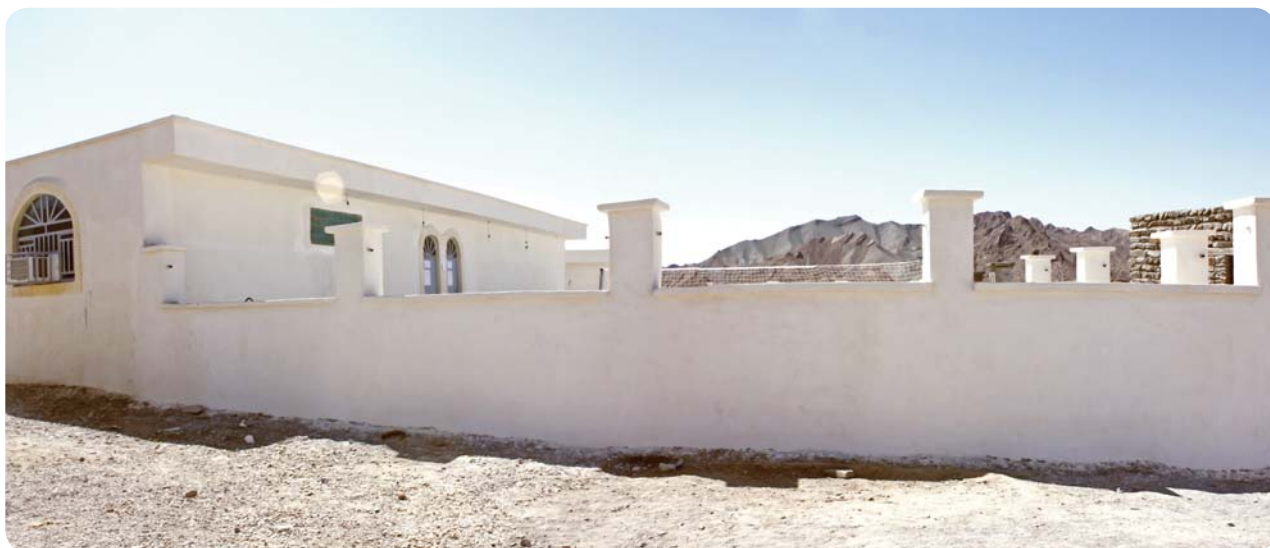
پایگاه فرهنگی روستای چوخون