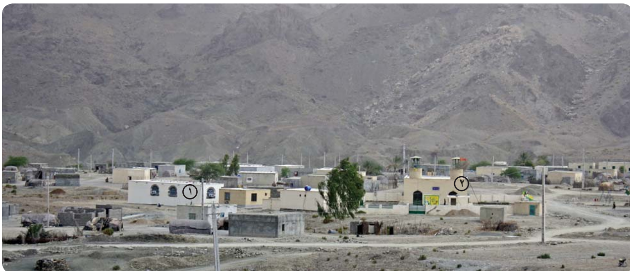
نمای روستای چوخون، پایگاه فرهنگی روستا (۱) در کنار مسجد (۲)