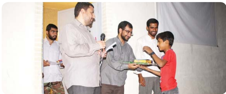
روستای کوه حیدر، مراسم اهدا جوایز، مسئولین پایگاه

اختتامیه: در آخرین شب حضور در روستا برنامه اختتامیه برگزار شد. بعد از نماز مغرب و عشاء، اهالی روستا در محوطه پایگاه یا مسجد گرد هم آمدند. بهانه اصلی این مراسم تقدیر از دانش‌آموزان و جوانانی بود که در کلاس‌های این دوره موفق‌تر بوده‌اند. برای هر درس آزمونی در نظر گرفته شده بود که در ساعت آخر کلاس‌ها با برگزاری آزمون، میزان یادگیری دانش‌آموزان محک زده شد. ملاک‌های دیگری نظیر حفظ سوره جمعه و میزان مشارکت در کلاس‌ها از دیگر معیارهای تعیین نفرات برتر بودند. کارگروه راهنمایی نیز معیارهای دقیقی برای تعیین نفرات برتر مشخص کرده بود. جوایز هدایی بیشتر جنبه معنوی و فرهنگی داشت که برای مثال جایزه نفرات برتر گروه خواهران دبیرستانی چادر مشکی بود. مراسم اهدا جوایز با برنامه‌های دیگری نظیر پخش فیلم و اجرای سرود و تئاتر بچه‌های راهنمایی همراه شده بود.