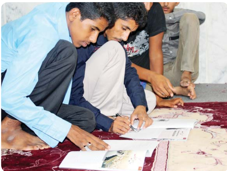
روستای چوخون، نشریه خط بیداری، برادران دبیرستانی

شدند.) معرفی گردیدند. برای شناخت بهتر شهیدان شیروودی و کشوری، فیلم سینمایی سیمرخ، با محوریت زندگی این دو بزرگوار پخش گردید.