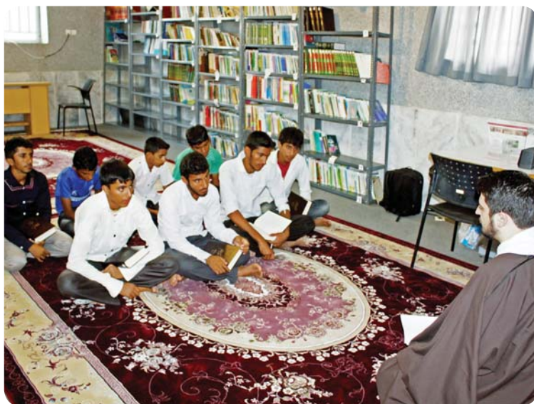
روستای چوخون، کلاس معرفتی، برادران دبیرستانی

(۱) آموزش قرآن: هدف غایی در این بخش ترویج فرهنگ انس با قرآن و تفکر و تدبر در آیات الهی است. به بیانی هدف تربیت مؤمنانی است که قرآن را دلیل راه خود ساخته و در تمامی مراحل زندگی خود از نور و هدایت آن بهره‌مند می‌گردند.