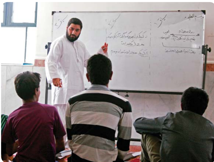
روستای درجگ، کلاس معرفتی، برادران دبیرستانی

کلی مربوط به روانخوانی است. گام اصلی ان شاء الله با تشکیل حلقه‌های قرآنی دانش‌آموزان در طول سال برداشته خواهد شد. لذا مریبان در طی این چند روز پیگیری‌های لازم مانند تأکید و تشویق دانش‌آموزان مبنی بر تشکیل حلقات، تعیین سوره، تعیین مربی از میان خود ایشان و تعیین کتابی برای آشنایی با مفاهیم سوره را انجام می‌دهند.