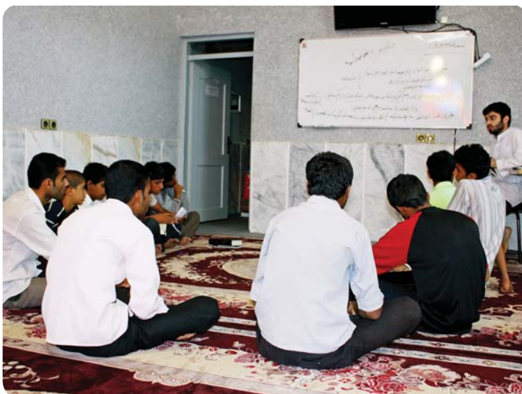
روستای کوه‌حیدر، کلاس معرفتی، برادران دبیرستانی

در این دوره جلسات پرسش و پاسخ در هر روستا و با طرح و برنامه مربی همان روستا برگزار گردید.