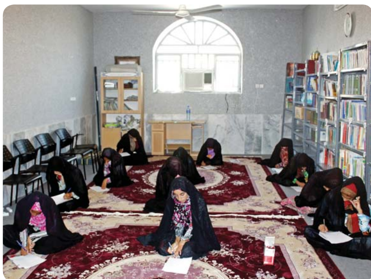
روستای چوخون، آزمون صهبا، خواهران دبیرستانی

به دلیل فرصت کوتاه کلاس‌ها در هر جلسه و محدودیت تعداد جلسات در هر اردو، چاره‌ای جز بودجه‌بندی محتواها و ادامه تدریس مابقی آنها در کلاس‌های اردوی بعد وجود نداشت، لذا مرکز صهبا با تقسیم‌بندی طرح درس‌ها به تناسب هر جلسه و هر اردو، حجم معینی از مطالب را در اختیار دبیران محترم جهت تدریس قرار می‌داد.