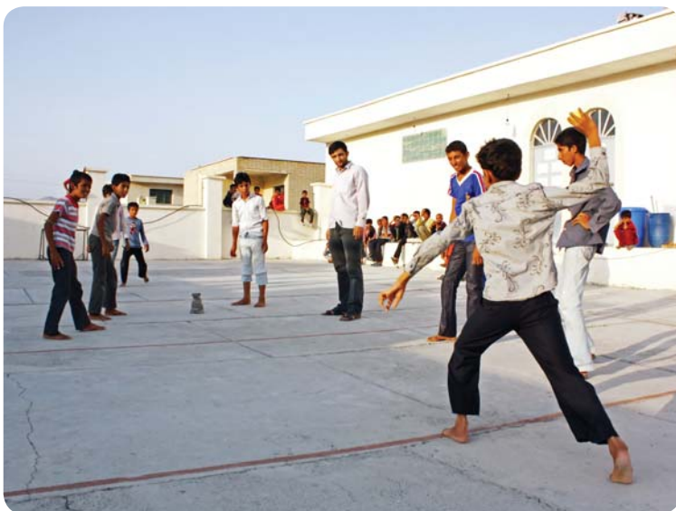
روستای چوخون، بازی‌های گروهی، برادران راهنمایی

شعر و نمایش دارند، همیشه از تئاتر که تلفیقی از این سه مورد است استقبال می‌کنند. این کلاس، با هدف تقویت روحیه‌ی کار گروهی در بچه‌ها طراحی، و در قالب پنج نمایشنامه به بچه‌ها ارائه شد. دانش‌آموزان ضمن حفظ کردن نمایشنامه‌ها، آنها را به خوبی اجرا کرده و با دوستان خود لحظاتی سرشار از تحرک و نشاط را سپری کردند.