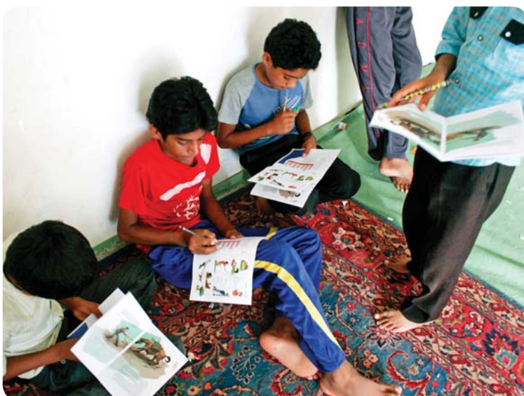
روستای درجگ، کتاب کار، برادران راهنمایی

ورزش و بازی‌های گروهی: ورزش یکی از مهمترین بخش‌های زندگی‌ست که باعث حفظ سلامتی در تمام سنین می‌شود. در کلاس‌های ورزش و بازی گروهی، معلمان سعی کردند که ضمن انجام حرکات ورزشی، دانش‌آموزان را با رقابت سالم و سازنده، نظم و ترتیب، چالاکتی و چابکی، همبستگی و تعاون و مفاهیمی از این دست به صورت عملی آشنا کنند.