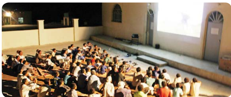
روستای کوه حیدر، پخش فیلم، جمعی از اهالی روستا

ورزش: بعد از کلاس دوم عصر تا اذان مغرب و بعد از نماز مغرب و عشاء تعدادی از جوانان روستا و اهالی برای بازی والیبال و فوتبال به حیاط پایگاه می‌آمدند. این زمان فرصت مناسبی برای گفتگو با دانش‌آموزان و ایجاد صمیمیت با معلمین ایجاد می‌کرد.