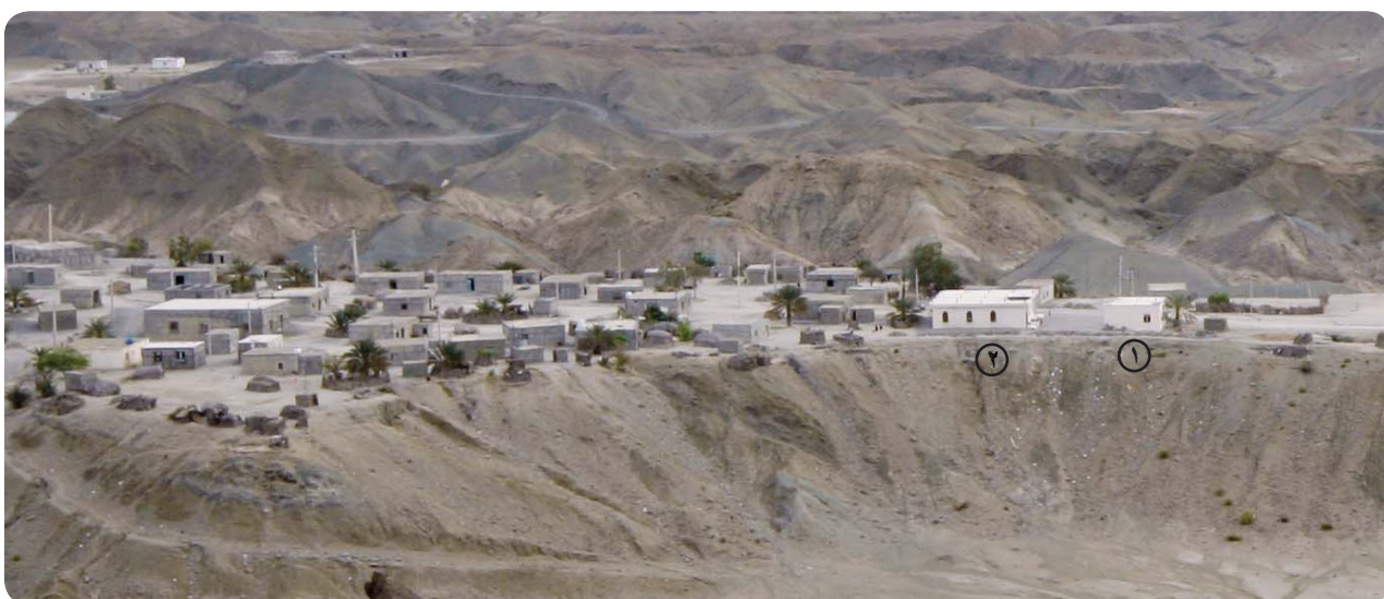
نمای روستای درجگ، پایگاه فرهنگی روستا (۱) در کنار مسجد (۲)