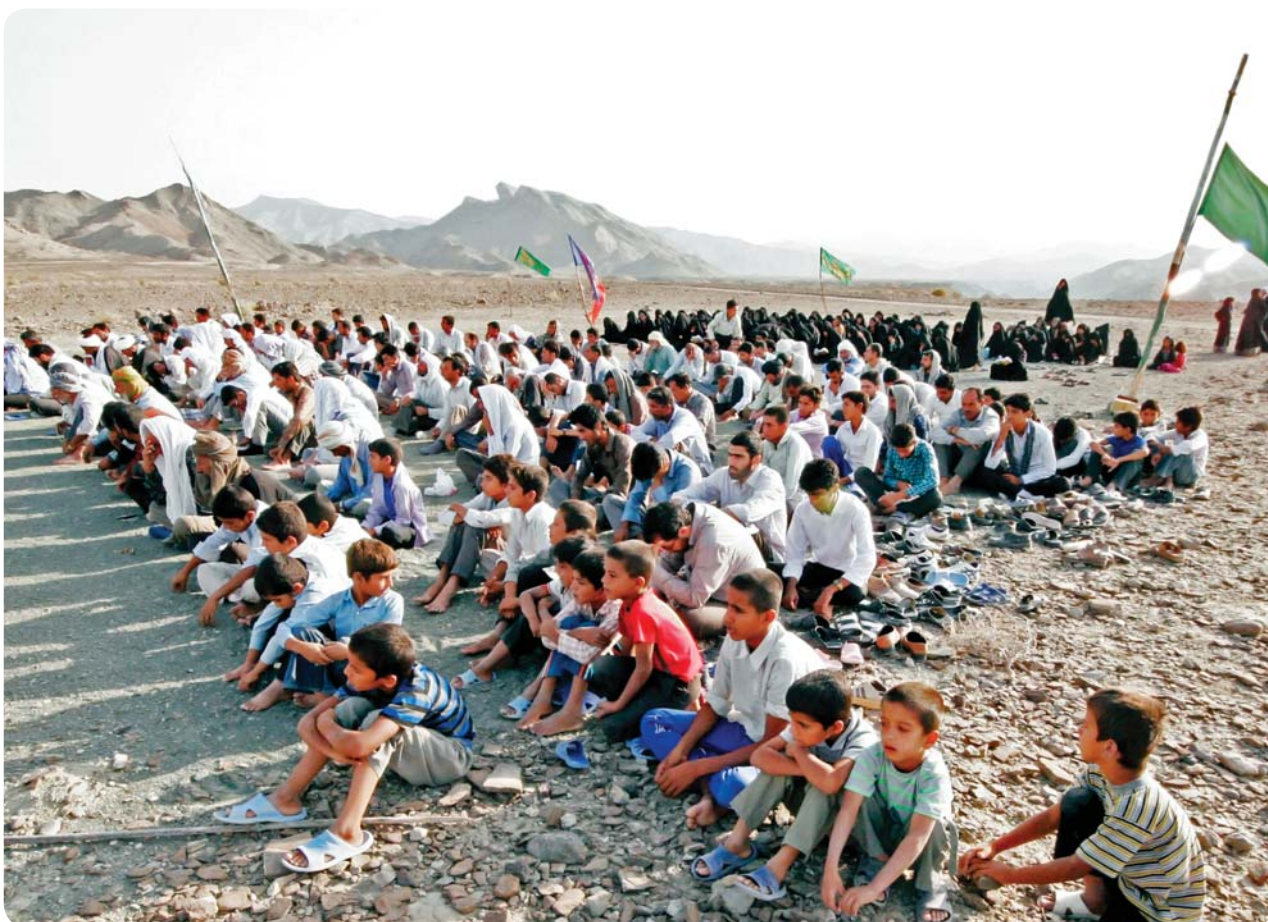
مهدیه زنگیک، دعای ندبه، اهالی حوزه زنگیک