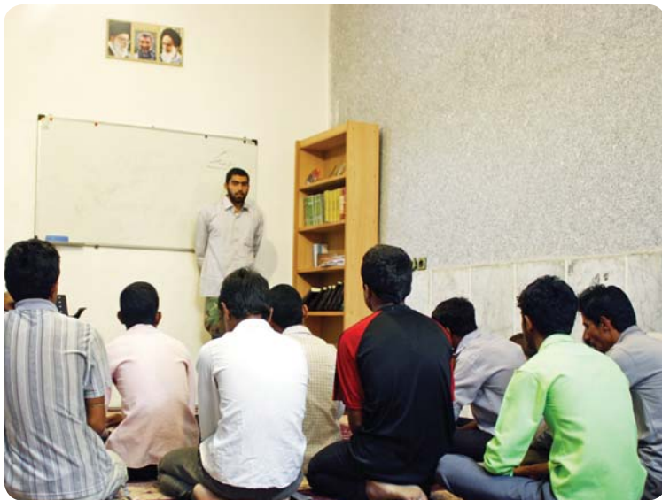
روستای کوه‌حیدر، کلاس نهضت امام و فرهنگ دفاع مقدس، برادران دبیرستانی

۲) دفاع مقدس: هدف از طرح این سرفصل انتقال فرهنگ غنی دوران دفاع مقدس است. آشنایی اجمالی با وقایع جنگ، شناخت سیره