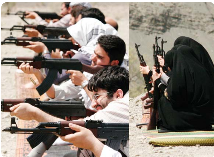
میدان تیر حوزه زنگیک، تیراندازی، اعضای موسسه جهادی

بعد از مراسم مهدیه اعضای موسسه به اتفاق راهی میدان تیر حوزه زنگیک شدند و با همکاری مسئولین و برادران بسیج حوزه زنگیک، برنامه تیراندازی خوبی برگزار شد که در آن، خواهران موسسه نیز شرکت داشتند. به نفرات برتر جوایزی اهدا گردید.