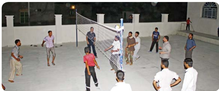
روستای کوه حیدر، ورزش، جمعی از جوانان روستا

ورزش: بعد از کلاس دوم عصر تا اذان مغرب و بعد از نماز مغرب و عشاء تعدادی از جوانان روستا و اهالی برای بازی والیبال و فوتبال به حیاط پایگاه می‌آمدند. این زمان فرصت مناسبی برای گفتگو با دانش‌آموزان و ایجاد صمیمیت با معلمین ایجاد می‌کرد.