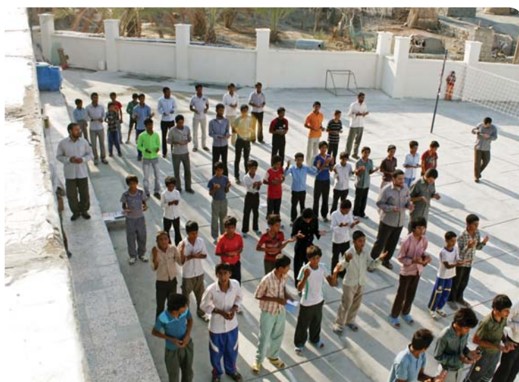
روستای کوه حیدر، مراسم صبحگاه، برادران راهنمایی و دبیرستانی

قبل از شروع کلاس‌ها، مراسم صبحگاه هر روز در حیاط پایگاه برگزار می‌گردید. برنامه به این ترتیب بود که حدود سی دقیقه قبل از شروع کلاس‌ها، با برنامه‌های متنوع ورزشی و دعا و مداحی، بچه‌ها آماده می‌شدند و بعد در صفوف خود منظم ایستاده و قرآن را استماع می‌کردند.