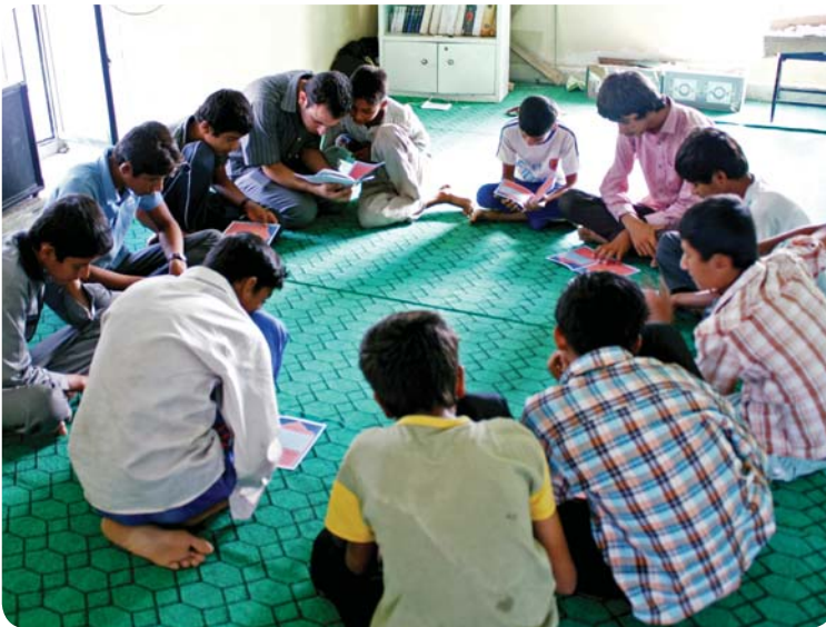
روستای کوه حیدر، کلاس قرآن، برادران راهنمایی

برنامه‌های مقطع راهنمایی، دانش‌آموزان مقاطع پنجم ابتدایی تا سوم راهنمایی را در بر می‌گرفت. برای دانش‌آموزان کلاس‌های مختلفی برگزار شد که جزئیات دروس ارائه شده در هر کلاس، به شرح زیر است: