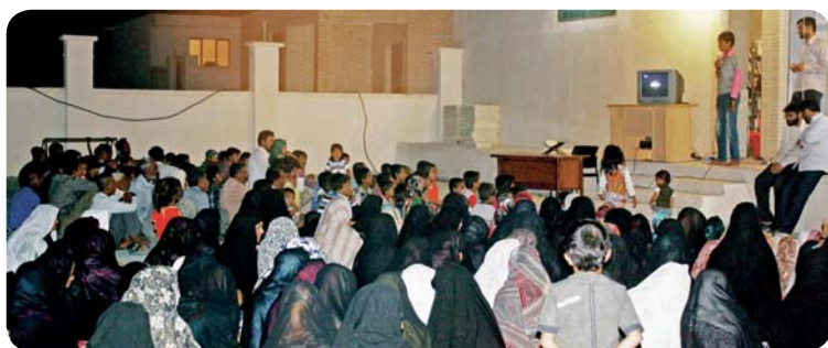
روستای چوخون، مراسم اختتامیه، جمعی از اهالی روستا

مواسم مذهبی: برنامه دعای کمیل و دعای توسل از برنامه‌های ثابت این روستاهاست که در حین برگزاری اردو نیز با مشارکت موسسه برگزار شد. برنامه نماز جماعت نیز برقرار بود و در بین نمازهای ظهر و عصر یا مغرب و عشاء، برنامه‌های کوتاهی نظیر تفسیر قرآن، احکام و... از سوی موسسه برای عموم روستا برگزار می‌شد.