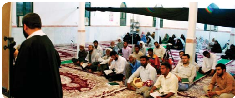
روستای درجگ، تفسیر قرآن بعد از نماز مغرب و عشاء، جمعی از اهالی روستا

پخش فیلم: فیلم‌های سینمایی «کودک و فرشته» و «سیمرخ» با موضوع دفاع مقدس برای عموم روستا پخش گردید. همچنین کلیپی از حاج عبدالله والی که در همایش ششمین سالگرد رحلت ایشان (شیدای ولی) برای اولین بار پخش شده بود، نمایش داده شد. مردم استقبال خوبی از برنامه پخش فیلم و به خصوص کلیپ حاج عبدالله نشان دادند.