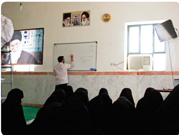
روستای درجگ، کلاس نهضت امام و فرهنگ دفاع مقدس، خواهران دبیرستانی