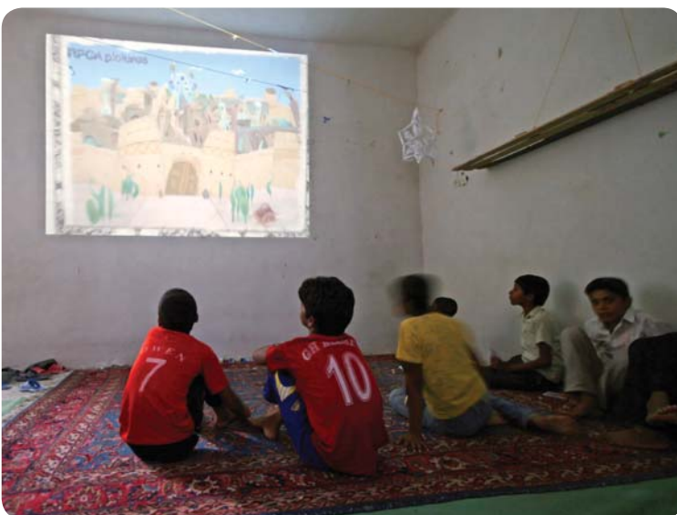
روستای درجگ، پخش فیلم، برادران راهنمایی

آموزش عربی: این درس به دو دلیل در دستور کار قرار گرفت: یکی آشنایی با زبان قرآن و علوم و معارف اسلامی و احادیث گهربار ائمه‌ی معصومین(ع) و دیگری درک بهتر و بیشتر ادبیات فارسی. شیوه‌ی کار این بود که در خلال کلاس‌های مختلف، برخی لغات پرکاربرد عربی به همراه مشتقات آنها در زبان فارسی با دانش‌آموزان تمرین شود تا آن لغات را یاد گرفته و به خاطر بسپارند.